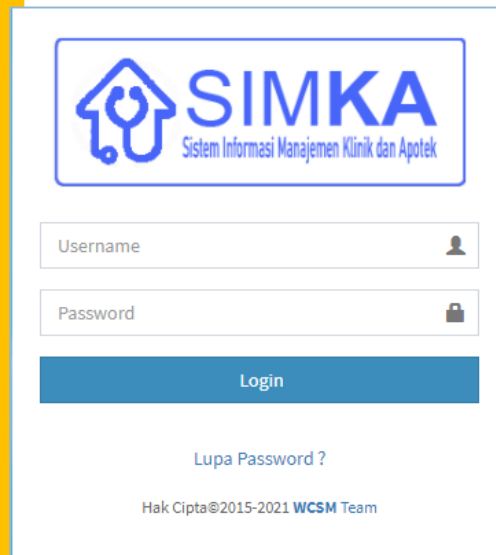
Gambar 1 Login Sistem

Untuk masuk ke dalam sistem, maka user harus memiliki username dan password seperti tampak dalam Gambar 1.